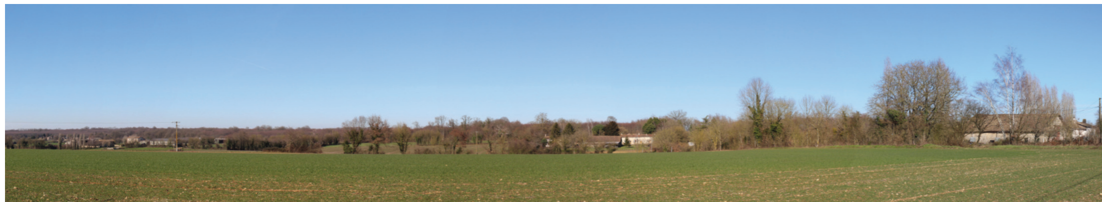
Vue panoramique de l'état initial (angle de vue 120°)